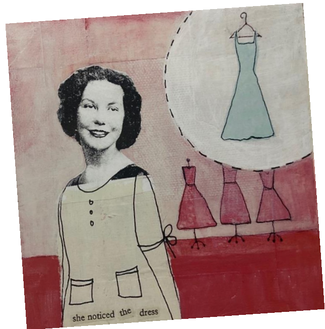
Όλα τα έργα είναι της Claudine Hellmuth και πάρθηκαν από το βιβλίο της Collage Discovery Workshop: Beyond the Unexpected . 2005, North Light Books, U.S.A.