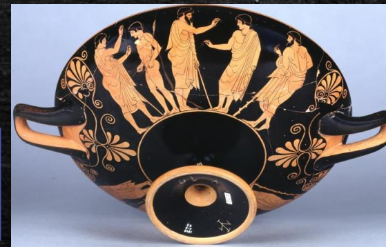
Αγγείο με σκηνή των Ολυμπιακών Αγώνων (στέψη νικητών) – 5 ος αιώνας π.Χ.