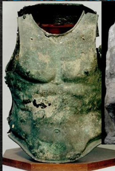
Μπρούντζινη πανοπλία – 5 ος αιώνας π.Χ.

Γεια σας παιδιά! Ας πάμε να μελετήσουμε τις σχέσεις των ομάδων της Κλασικής εποχής. Σύμφωνα με αυτά που είχαμε μελετήσει για άλλες εποχές, τι σχέσεις υποθέτετε ότι μπορεί να υπήρχαν μεταξύ τους άραγε; Τα διπλανά ευρήματα μπορούν να σε βοηθήσουν ακόμα περισσότερο!