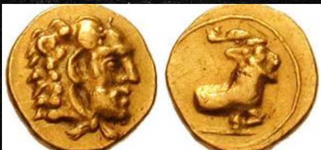
Χρυσά νομίσματα την εποχή του Ευαγόρα

Παιδιά, τι νομίζετε ότι έκανε άραγε ο Ευαγόρας;