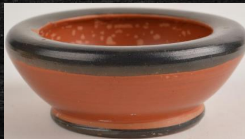
Ελληνικό δοχείο που βρέθηκε στην Σαλαμίνα 4 ος αιώνας π.Χ. – Βρετανικό Μουσείο