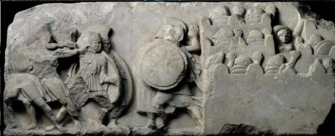
Μαρμάρινη πολεμική σκηνή από το μνημείο των Νηρηίδων – 5 ος αιώνας π.Χ.