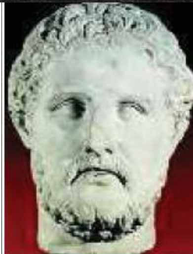
2. Μαρμάρινο κεφάλι του Αλκιβιάδη (Γλυπτοθήκη Ny Carlsberg, Κοπεγχάγη)