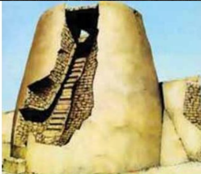
Αναπαράσταση οικίας από το νεολιθικό οικισμό της Ιεριχού