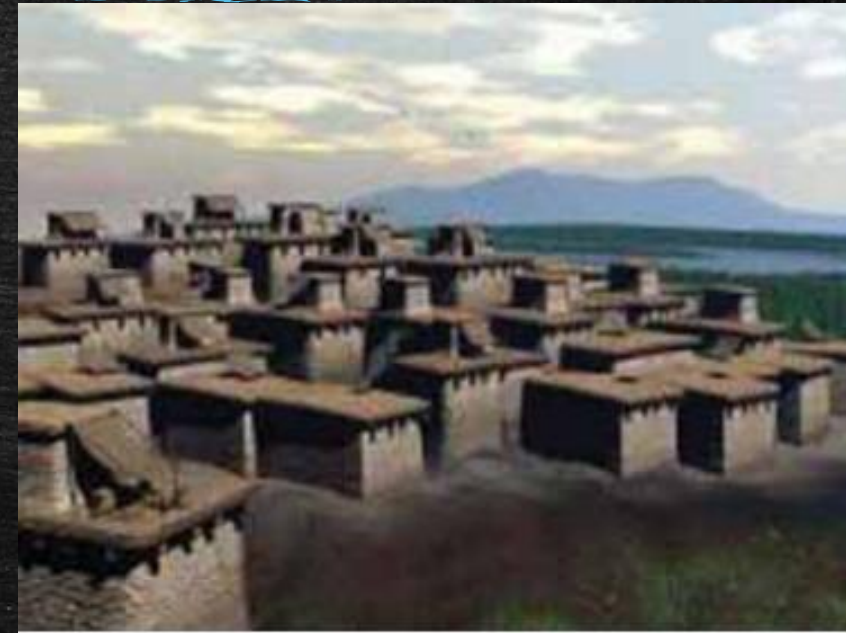
Αναπαράσταση νεολιθικού οικισμού Τσαταλχουγιούκ