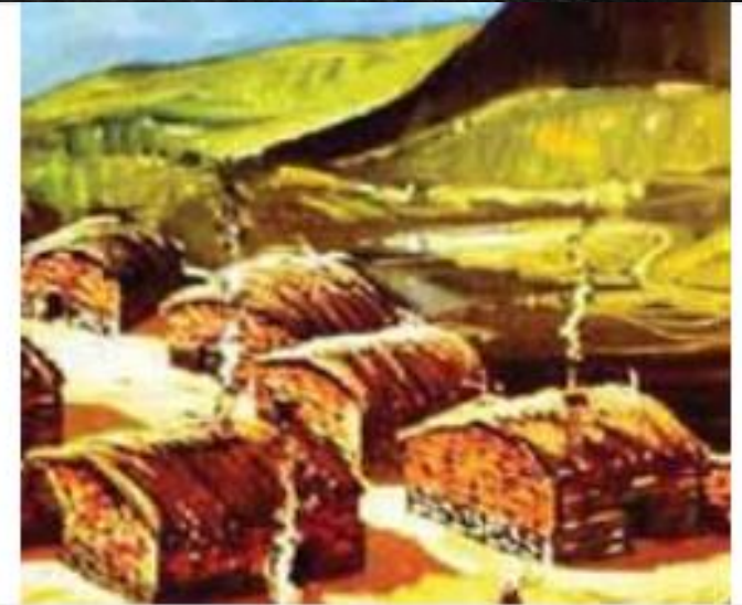
Αναπαράσταση οικιών του Σέσκλου