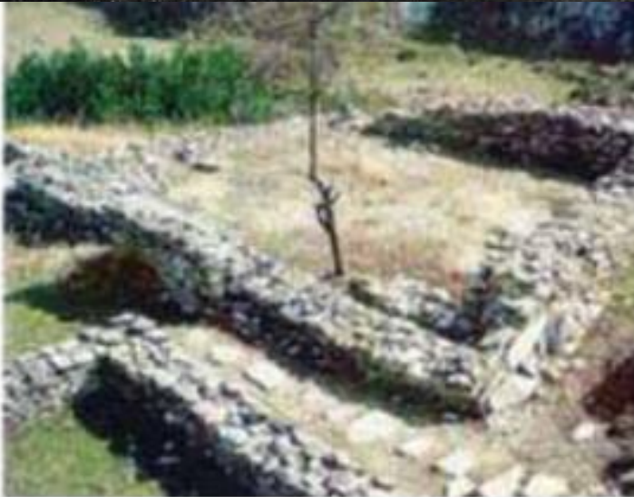
Κατάλοιπα του νεολιθικού οικισμού του Σέσκλου