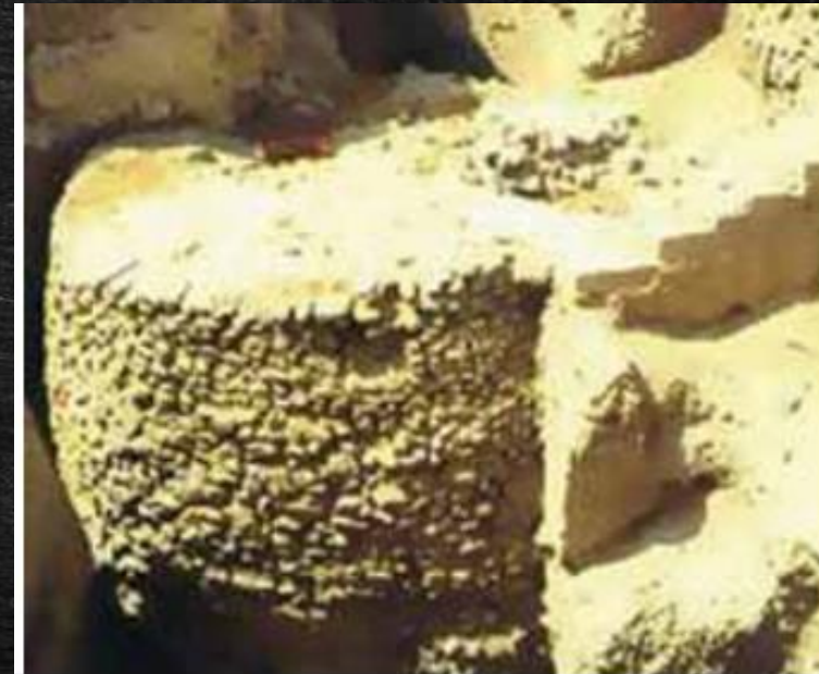
Κατάλοιπα οικίας από τη νεολιθική Ιεριχώ