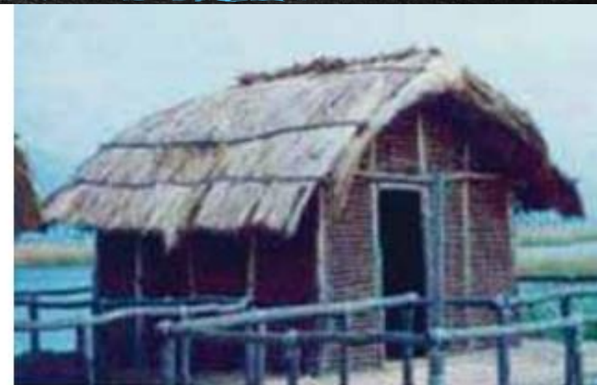
Ανακατασκευασμένη οικία από τον νεολιθικό οικισμό του Δισπηλιού.