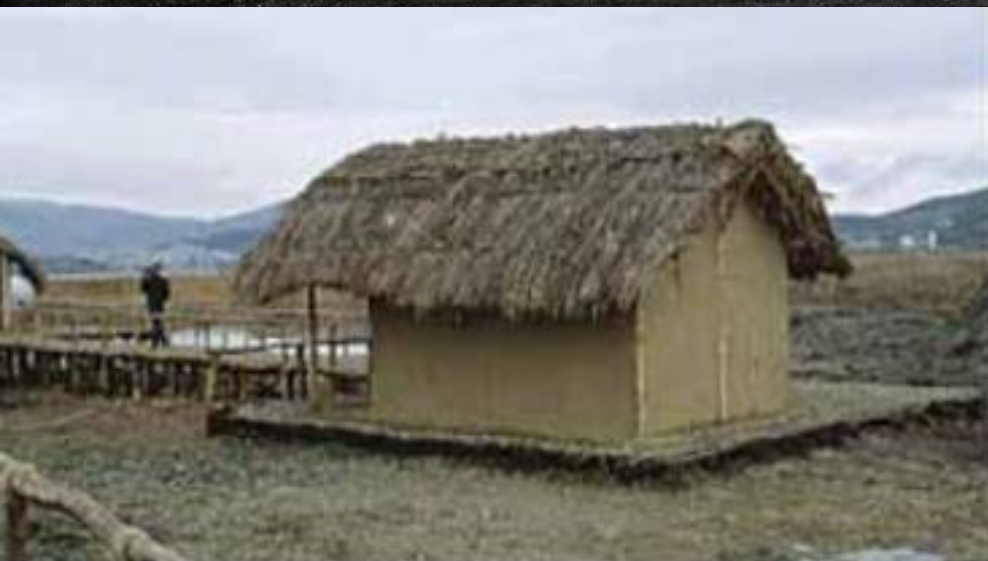
Ανακατασκευασμένη οικία από τον νεολιθικό οικισμό του Δισπηλιού.