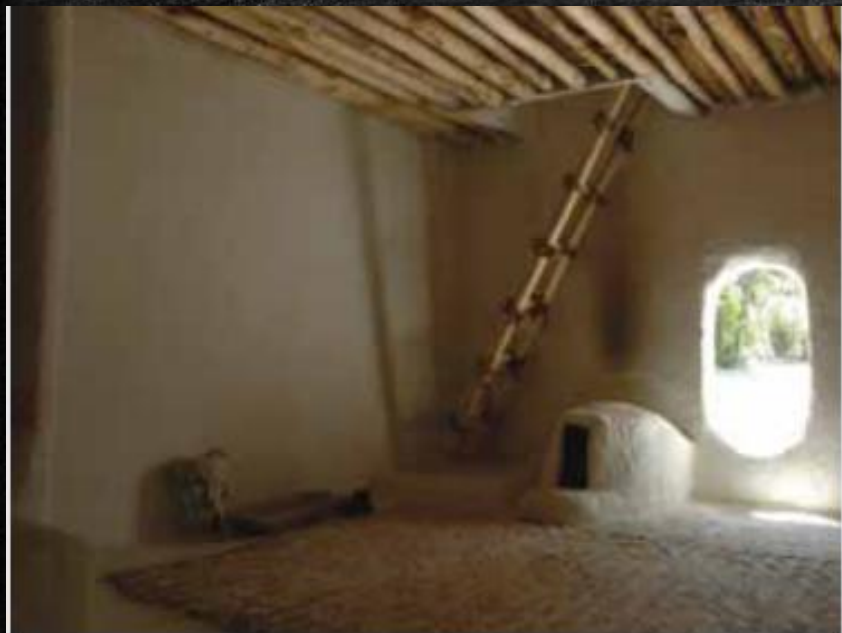
Εσωτερικό οικίας (ανακατασκευή από αρχαιολόγους)