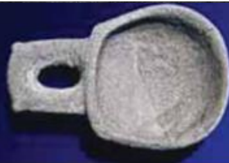
Λίθινο δοχείο με λαβή