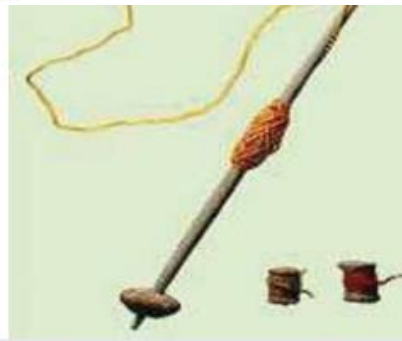
Σφοντύλι και πηνία (κουβαρίστρες) από πηλό (αναπαράσταση)

Τι μπορούν να μας πουν τα ευρήματα για τις ασχολίες, τη διατροφή και την ένδυση των ανθρώπων της Νεολιθικής Εποχής, στην Ελλάδα;