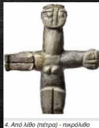
4. Από λίθο (πέτρα) - πικρόλιθο