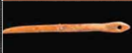
Κοκάλινη (οστέινη) βελόνα (Χοιροκοπία)