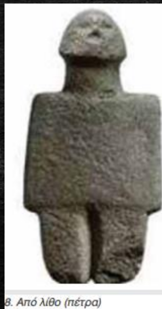
8. Από λίθο (πέτρα)