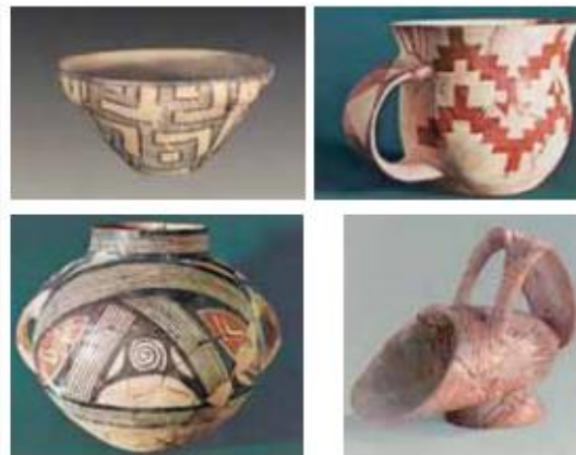
Αγγεία (δοχεία) για διάφορες χρήσεις