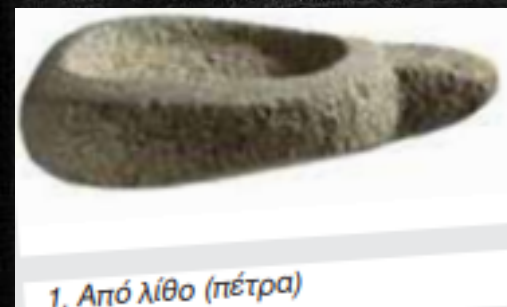
1. Από λίθο (πέτρα)

Ωχ! Οι καρτέλες των νεολιθικών ευρημάτων μπερδεύτηκαν! Μπορείς να αντιστοιχίσεις άραγε το κάθε εργαλείο με τη σωστή καρτέλα;