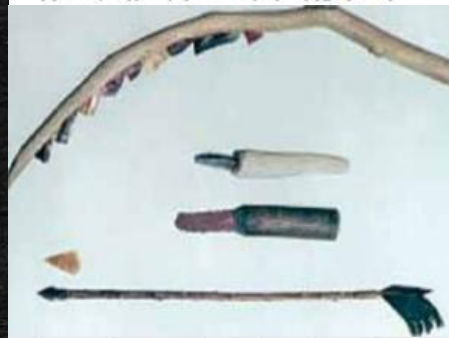
Βέλος, λεπίδες, δρεπάνι από λίθο, ξύλο και δέρμα ζώων