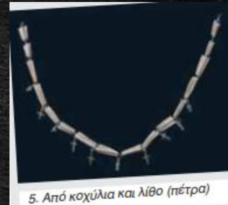
5. Από κοχύλια και λίθο (πέτρα)