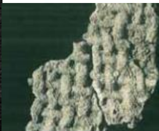
Απολίθωμα από κομμάτι υφάσματος, πιθανότατα μαλλί προβάτου (Χοιροκοπία)