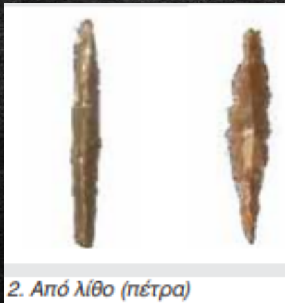
2. Από λίθο (πέτρα)