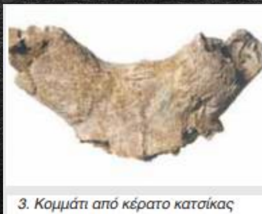
3. Κομμάτι από κέρατο κατσίκας