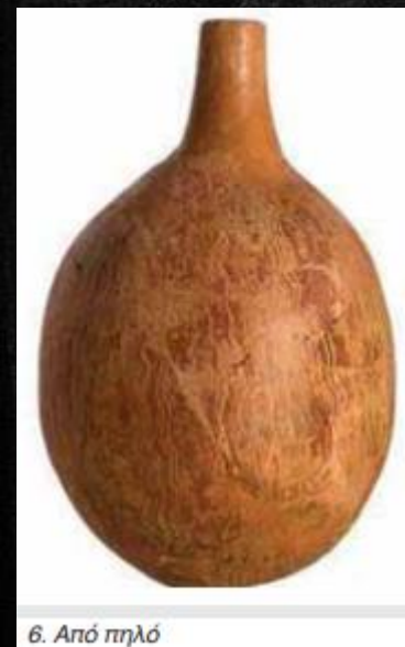
6. Από πηλό