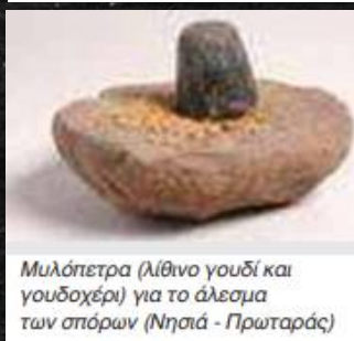
Μυλόπετρα (λίθινο γουδί και γουδοχέρι) για το άλεσμα των σπόρων (Νησιά - Πρωταράς)