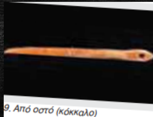
9. Από οστό (κόκκαλο)

Η ιστορία μου, οι ιστορίες μου, η ιστορία μας, οι ιστορίες μας, Μέρος Β', σελ. 17