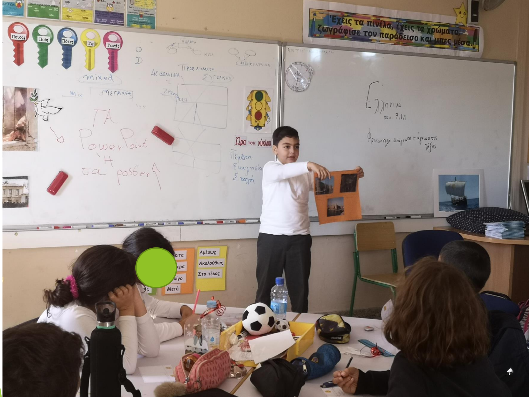
Παρουσίαση αφίσας για την πόλη της Αμμοχώστου.