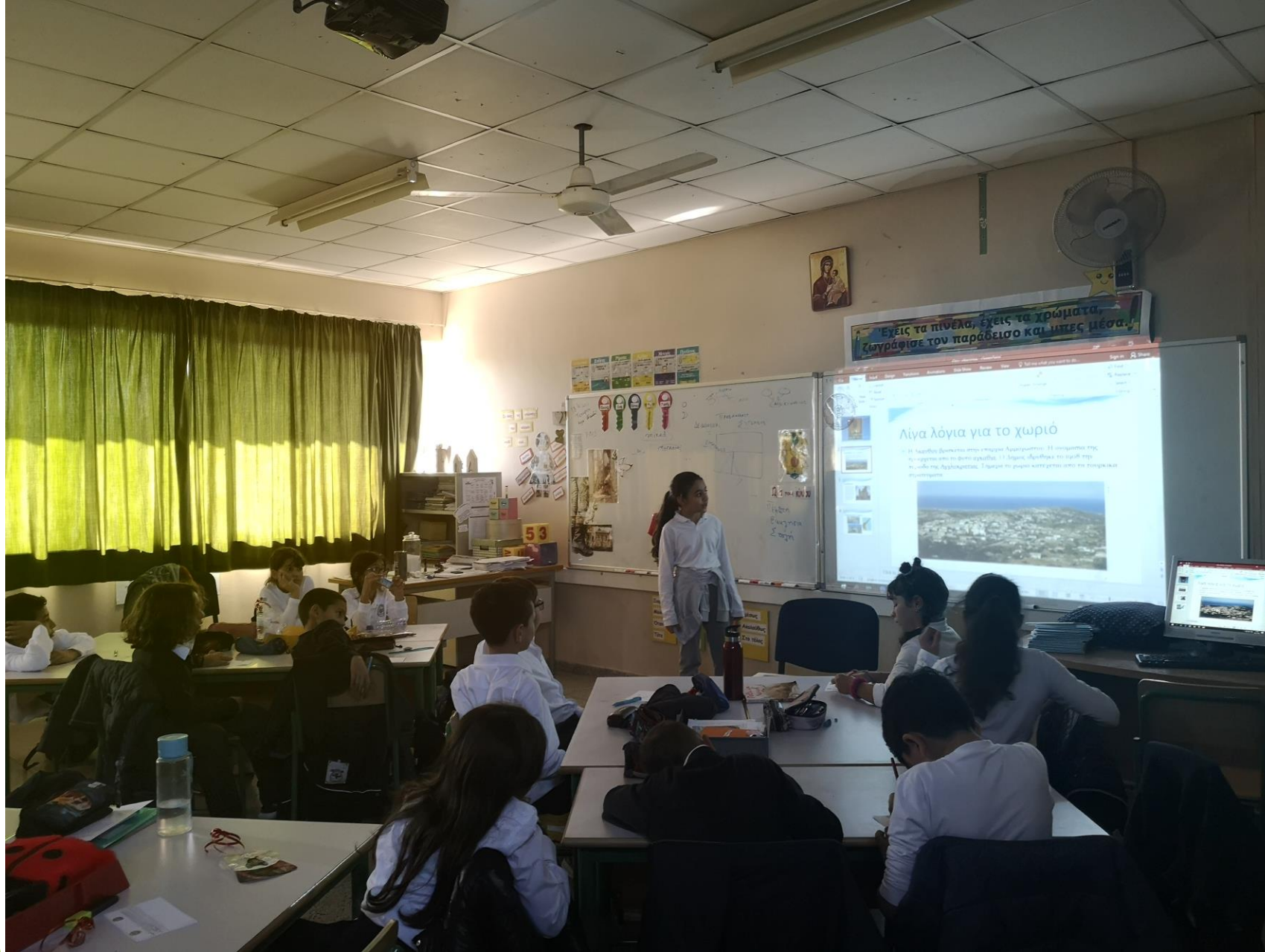
Παρουσίαση για το κατεχόμενο χωριό Ακανθού και την εκκλησία του Χρυσοσώτηρος.